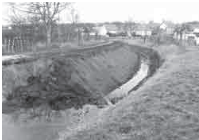
Čištění Otnického potoka

(otnický potok) dodavatelské firmě Sates Morava s.r.o. Valašské Meziříčí. Práce by měly být zahájeny v lednu a dokončeny do konce února 2013.