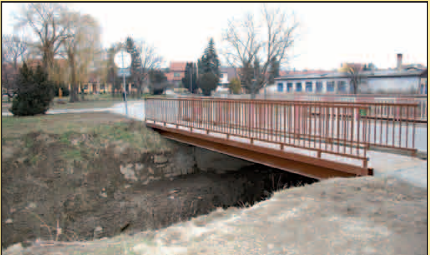
...přibyla lávka pro chodce i na levé straně.