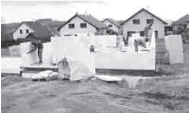
Výstavba Pod Vodárnou