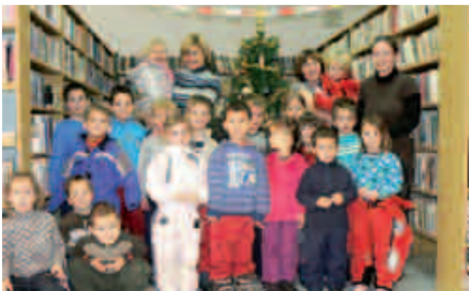
Děti z MŠ v knihovně