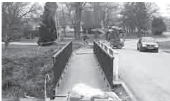
Lávka přes potok