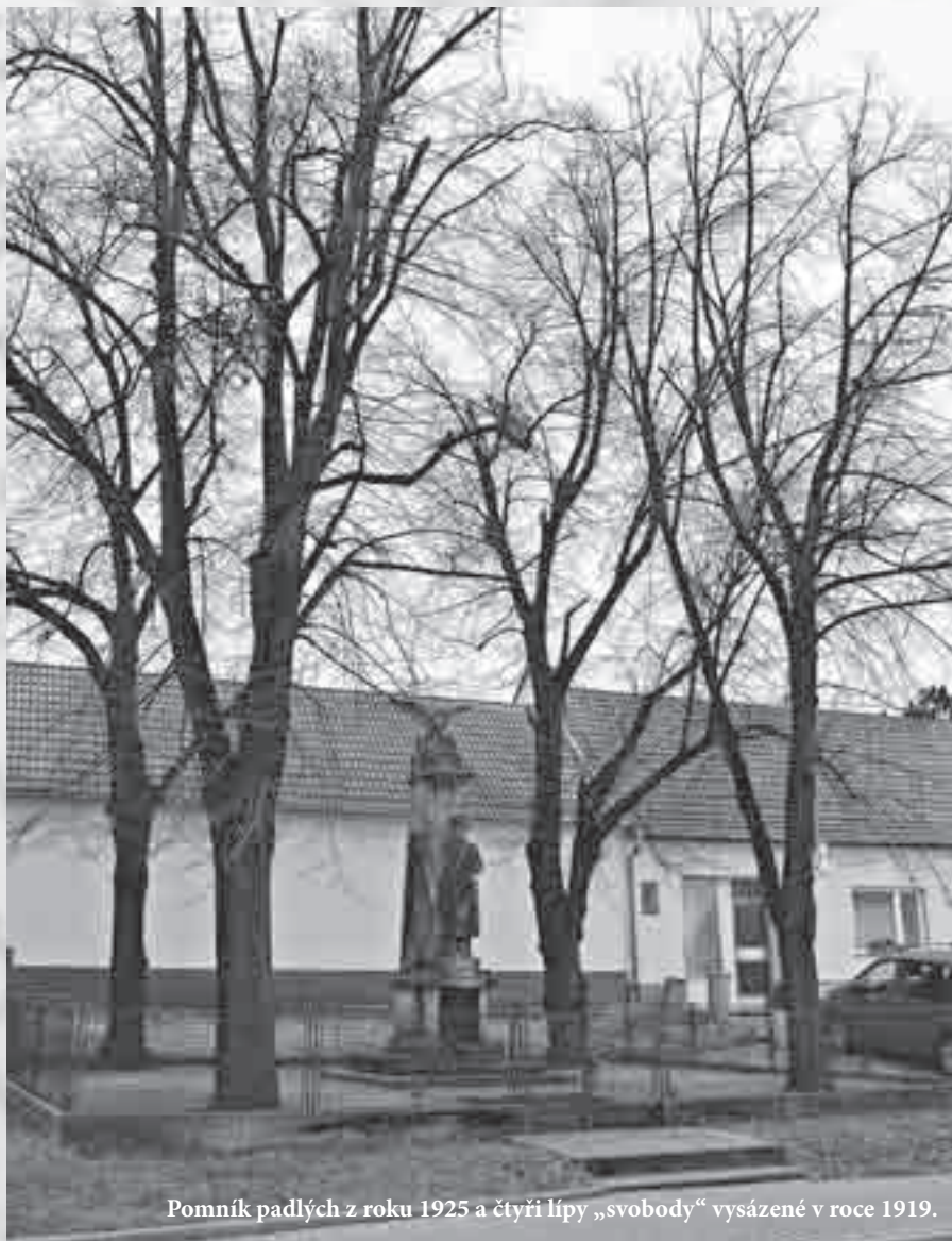
Pomník padlých z roku 1925 a čtyři lípy „svobody“ vysázené v roce 1919.