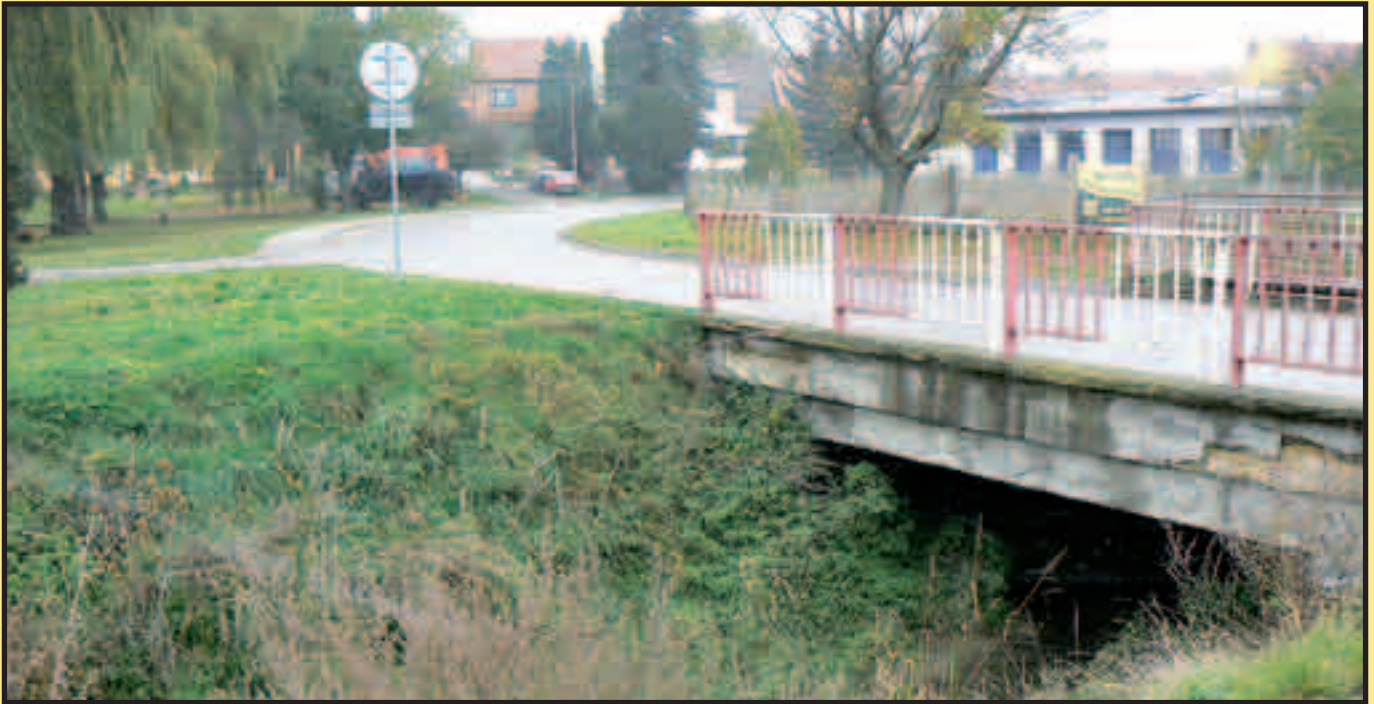
Most na ulici U Parku...