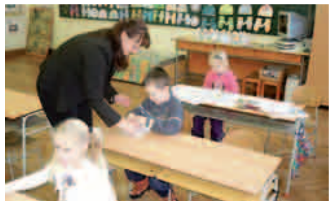
Zápis do 1. třídy