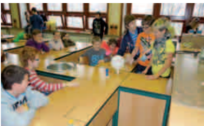
Motivační pokusy z fyziky