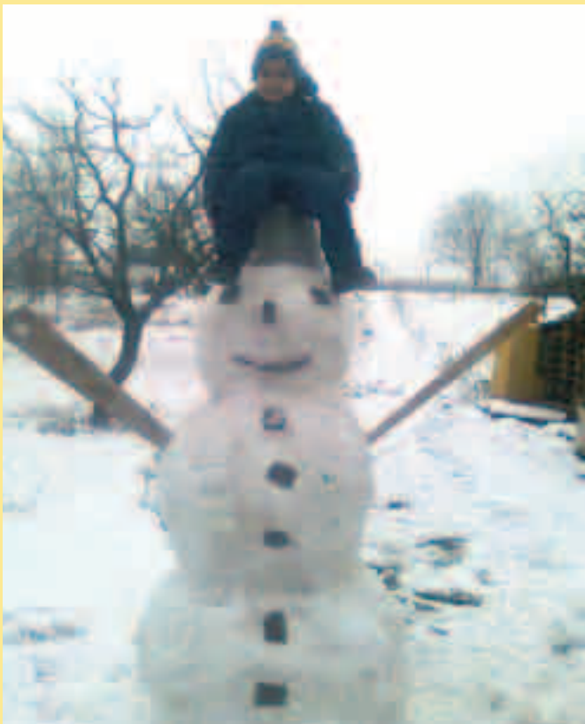
Rozhledna Radimka Rafaje.