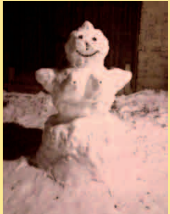
Sněhulačka rodiny Menouškovi z ul. Lipová